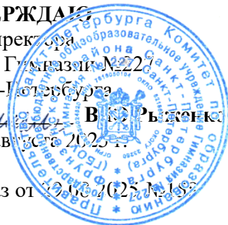
ГРАФИК ПРОВЕДЕНИЯ ОЦЕНОЧНЫХ ПРОЦЕДУР

Государственного бюджетного общеобразовательного учреждения Гимназии №227 Фрунзенского района Санкт-Петербурга в 2025/2026 учебном году