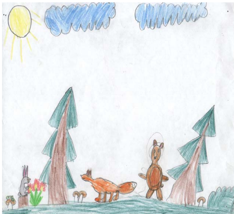
Полторако Вика, 1б

Зайка спрятался под елку. И погрыз зачем – то ствол. И упала елка – бах! Все расстроились, что же случилось? Под елкой зайка был – малыш. Разгадали мы загадку: Это зайка елочку погрыз. Оболенская Катя, 2б