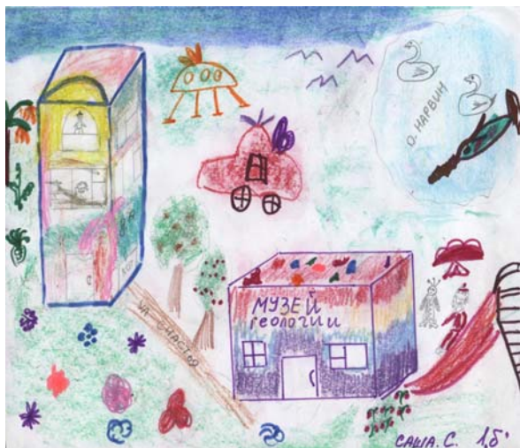
Собыленская Саша, 16